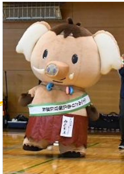
みどり市マスコットキャラクター みどモス