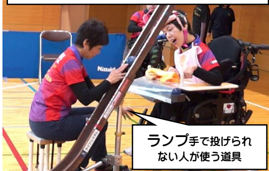
ランプ手で投げられない人が使う道具

9月10日(土)前哨戦 関東近郊 BC3 大会 日本選手権で活躍する、ランプを使うクラスの選手たちが真剣勝負。見ごたえのある試合を観覧することができます。