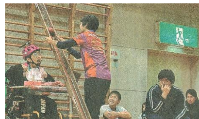
写真④ 2023年11月28日上毛新聞より

2029年、群馬県開催の全国障害者スポーツ大会ではみどり市でボッチャ競技が行われるため、今後ますます選手たちの活躍の場が広がると期待されます。